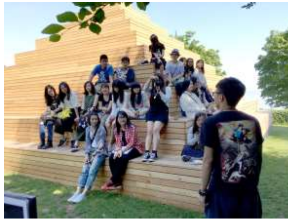
Louisiana Modern Art Museum, Denmark