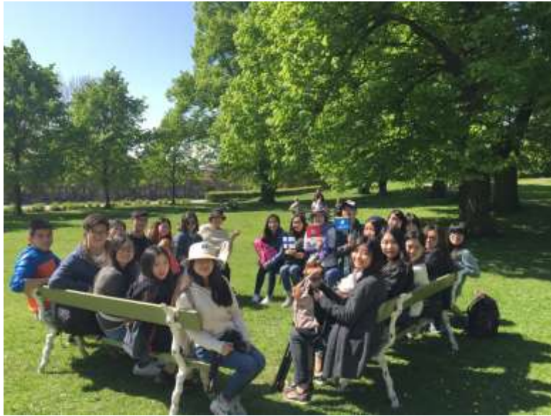
Suomenlinna Island, Finland